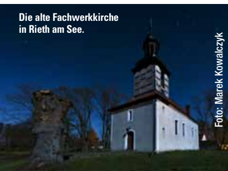
Die alte Fachwerkkirche in Rieth am See.