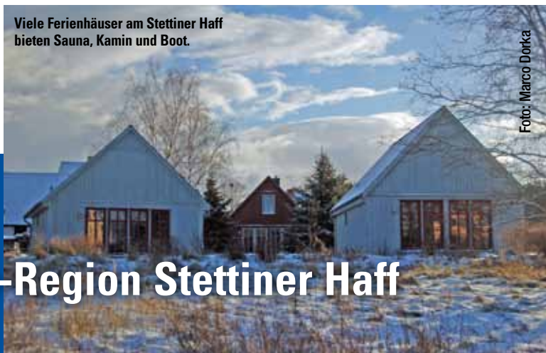
Viele Ferienhäuser am Stettiner Haff bieten Sauna, Kamin und Boot.

Ob Strandhaus, Küstenchalet oder Segelmacherhaus, individuell und komfortabel eingerichtete Ferienhäuser machen Lust auf Urlaub.