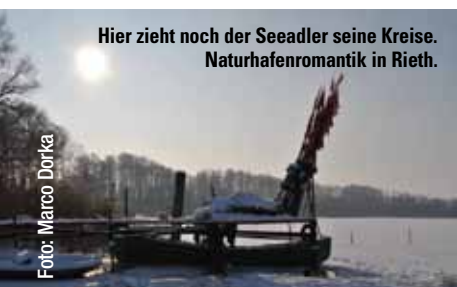
Hier zieht noch der Seeadler seine Kreise. Naturhafenromantik in Rieth.