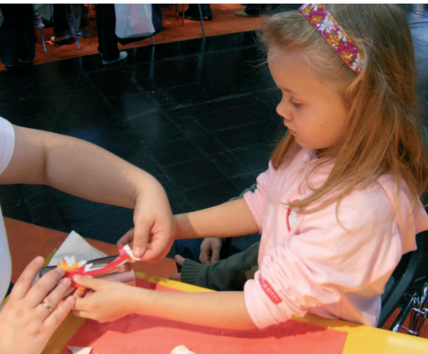
DIE GROSSAKTION DES VEREINS KREATIV HILFT E. V. 2007 AKTIVIERTE KINDER, UM KRANKE KINDER MIT BASTEL-MATERIAL IN BUNTEN PAKETEN ZU ERFREUEN.

D er gemeinnützige Verein verfolgt das Ziel, Kindern durch gestalterische Kreativ-Workshops zu neuem Lebensmut zu verhelfen und so im weitesten Sinn auch im Bereich der Therapie krankheitslindernd zu wirken. Eine der ersten Aktionen des Vereins war die „Kreative Post an den Weihnachtsmann“. Auf der Messe „modell-hobby-spiel“ in Leipzig wurden dafür im vorigen Jahr 2.000 Pakete gepackt – von Kindern für Kinder: reich bestückt und verziert mit Materialspenden der Kreativ-Hersteller. Diese Pakete wurden an Kinder in verschiedenen Reha-Kliniken ausgeliefert und sorgten in der Weihnachtszeit für große Freude und den Anreiz, aus den Materialien schöne Objekte zu schaffen. Das Netz des Vereins reicht weit: Die Deutsche Post übernahm die Kosten für Paketporto, Logistik und Versand.