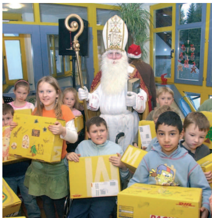
NIKOLAUS UND DIE KLEINEN PATIENTEN DER KATHARINEN-HÖHE SCHÖNWALD STRAHLEN UM DIE WETTE BEI ANKUNFT DER KREATIVPAKETE DES VEREINS.